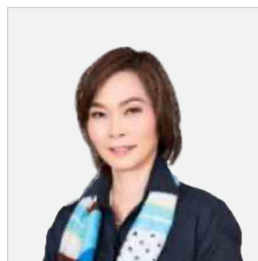
ดวงฤดี มีสินทางกูร

กรรมการธรรมาภิบาล และการพัฒนาเพื่อความยั่งยืน