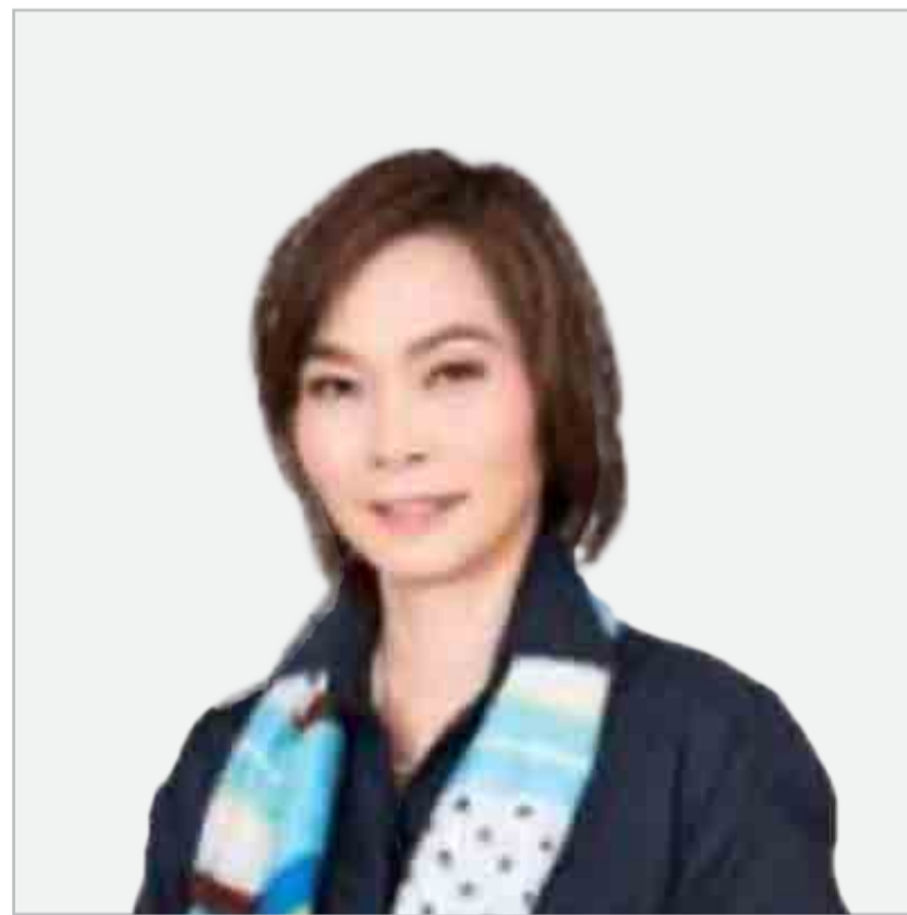
ดวงฤดี มีสินทางกูร

ประธานเจ้าหน้าที่บริหารสายงานสื่อสารองค์กร